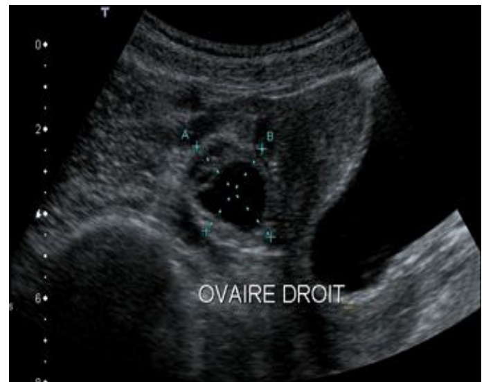
Figure 3 : Image échographique, en coupe sagittale, montrant une structure ovarienne latéro-utérine droite avec des follicules périphériques et un follicule dominant.

En latéro-utérine à droite, on visualisait une structure ovarienne mesurant 37 x 17 mm de dimension, contenant des follicules périphériques physiologiques et un follicule dominant [Figure 3].