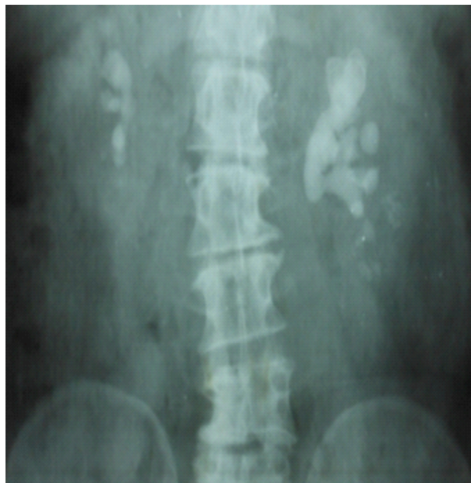
Figure 2 : Cliché de l'arbre urinaire sans préparation (AuSP) montrant un calcul coralliforme bilatéral : P2TsmiCsmi à gauche et P2TCsmi à droite.

Le bilan biologique avait révélé une anémie chez 28,8% (15 cas), une insuffisance rénale chez 23,1% (12 cas), une infection urinaire chez 28,8% (15 cas). L'uroculture avait permis d'isoler Pseudomonas aeruginosa (4 cas), Proteus mirabilis (4 cas), Escherichia coli (3 cas), Klebsiella pneumoniae (2 cas), Morganella morganii (1 cas) et Staphylococcus aureus (1 cas). Aucun patient n'avait réalisé la scintigraphie rénale.