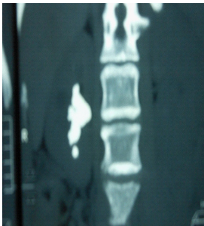
Figure 3 : Cliché d'uroTDM montrant un calcul coralliforme droit (P2TCsmi) associé à un calcul rénal non coralliforme homolatéral.